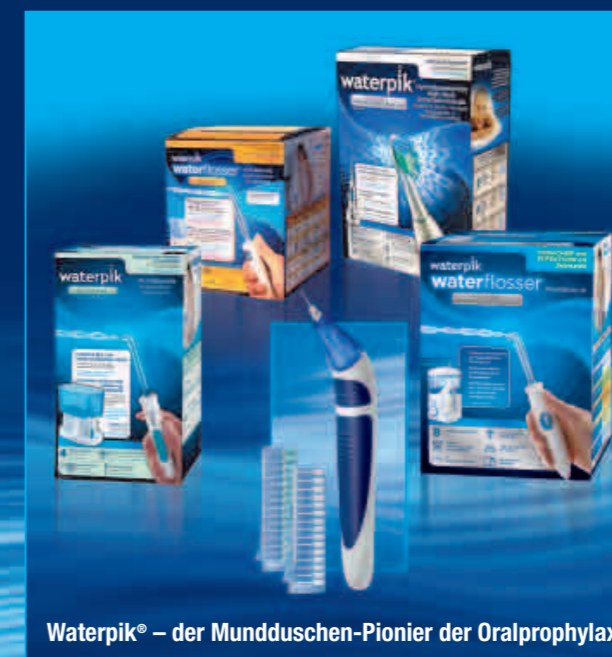
Waterpik® – der Mundduschen-Pionier der Oralprophylaxe

*Rosema et al., ACTA Amsterdam, in Journal of the International Academy of Periodontology 2011, 13/1: 2-10